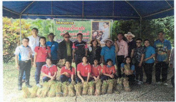
โครงการปลูกหญ้าแฝกและบำรุงรักษา