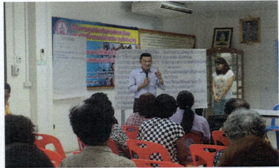
โครงการสนับสนุนการมีส่วนร่วมของประชาชนในการจัดทำเวทีประชาคมเพื่อจัดทำแผนพัฒนาท้องถิ่น