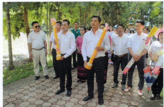
โครงการจัดกิจกรรมในวันสำคัญทางศาสนา