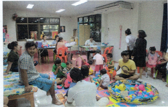
การให้บริการด้านสาธารณสุขของศูนย์บริการสาธารณสุขเทศบาลตำบลวังไผ่