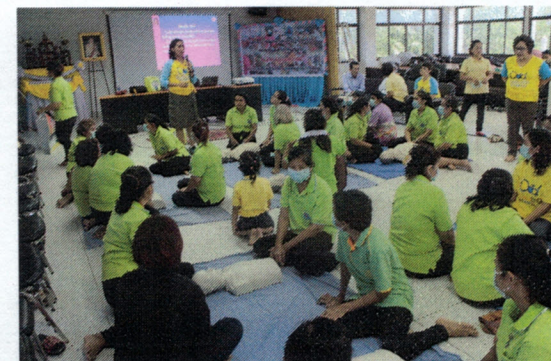
โครงการอบรมการช่วยชีวิตขั้นพื้นฐาน