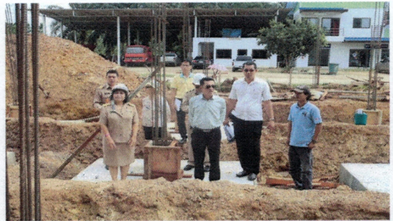
โครงการก่อสร้างศูนย์บริการสาธารณสุขเทศบาลตำบลวัง