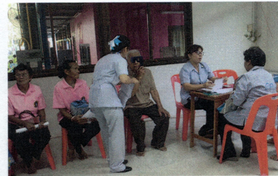
โครงการดูแลผู้สูงอายุแบบองค์รวม