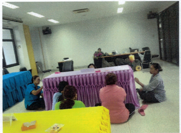
โครงการพัฒนาและส่งเสริมอาชีพ