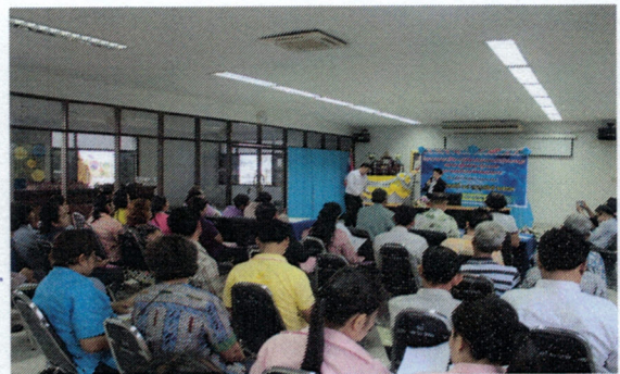
โครงการอบรมให้ความรู้เกี่ยวกับงานทะเบียนราษฎรแก่กำนัน ผู้ใหญ่บ้าน ผู้นำชุมชน และอาสาสมัครสาธารณสุข