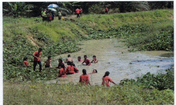
โครงการปลูกจิตสำนึกด้านสิ่งแวดล้อมให้แก่เด็กและเยาวชนในเขตเทศบาลตำบลวัง