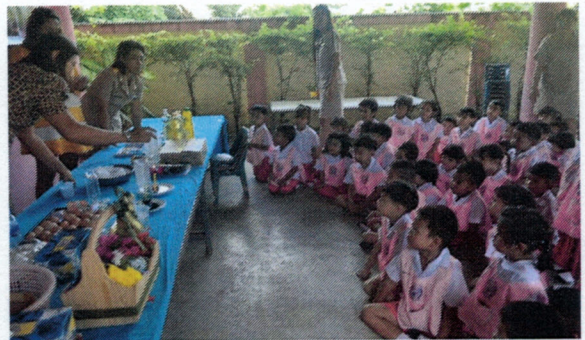
โครงการสนับสนุนการจัดกิจกรรมของศูนย์พัฒนาเด็กเล็ก