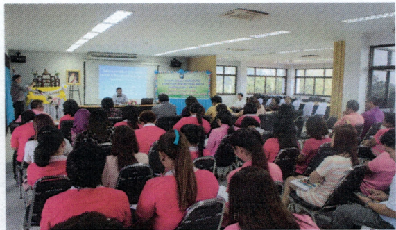
โครงการอบรมให้ความรู้เกี่ยวกับวินัยและสิทธิประโยชน์ของบุคลากรของเทศบาล