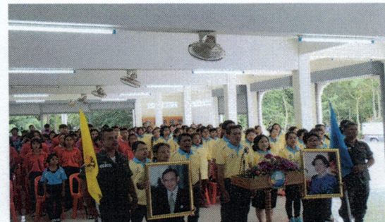
โครงการอบรมให้ความรู้และรณรงค์เพื่อป้องกันสารเสพติดและสนับสนุนให้หน่วยงานที่เกี่ยวข้อง